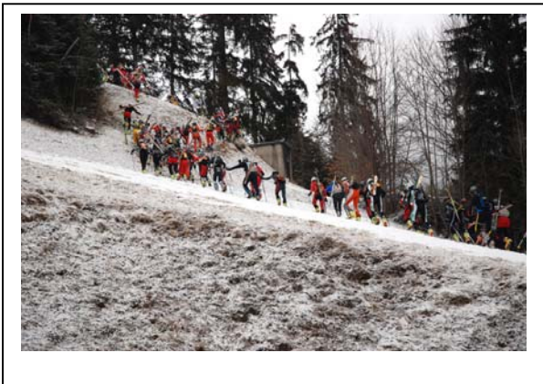
Erste Teilstrecke heuer Schi am Rucksack