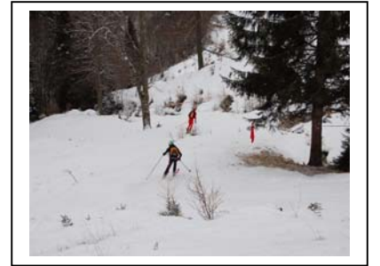
Wolfgang Klocker ist vorne...