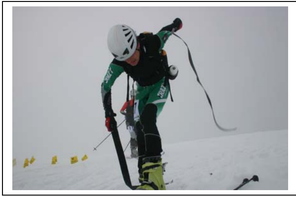
In der Wechselzone auf der Samalm geht's rund!!!