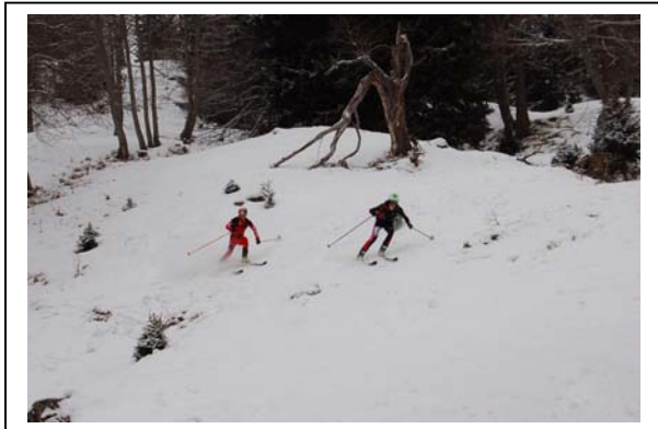
Überholmanöver – Kampf um Platz 2.