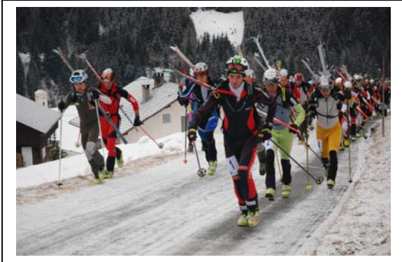
106 Rennläufer im Teilnehmerfeld